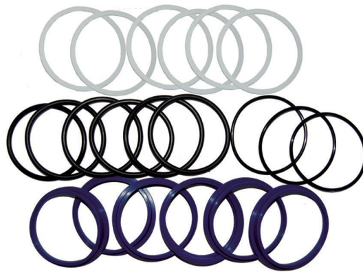
Kit riparazione pinza freno